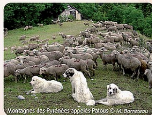
Montagnes des Pyrénées appelés Patous