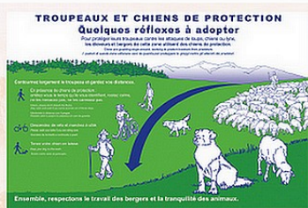
Ensemble, respectons le travail des bergers et la tranquillité des animaux.