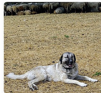
Berger d'Anatolie

Né en bergerie, le chiot développe un attachement très fort avec les animaux du troupeau : leur relation s'établit jusqu'à une acceptation totale et réciproque. Après quoi le chien vit de manière permanente au sein du troupeau, l'été sur le pâturage et l'hiver en bergerie. Ces liens le conditionnent pour réagir instinctivement à toute intrusion contre le troupeau.